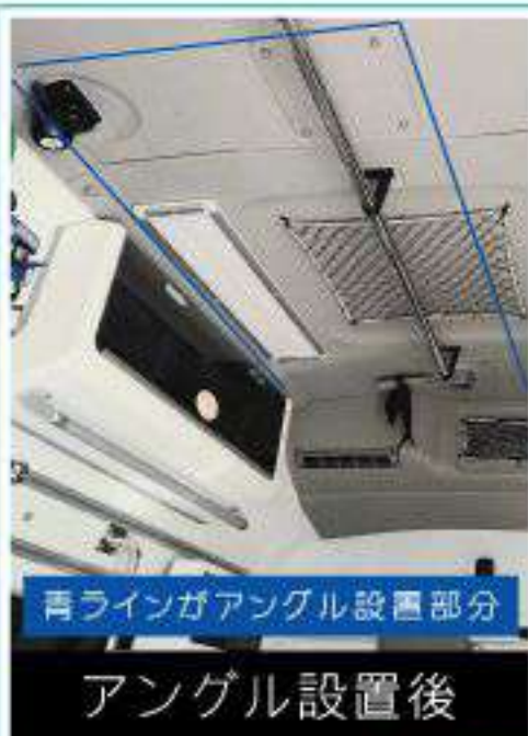
再ラインガアングル設置部分

車体に直接テープ付きビニールカーテンを貼り付けると、材質や表面状態により剥がれやすい事があります。当製品ではテープの接着を助け、また取り外し時は剥がれやすいように設計されています。